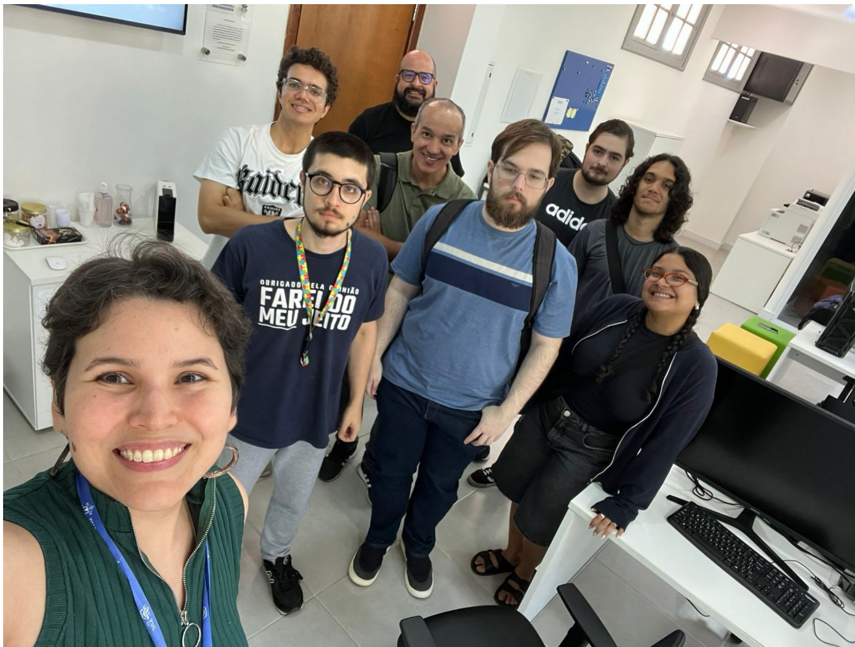
Aula - História Digital (com Departamento de História)