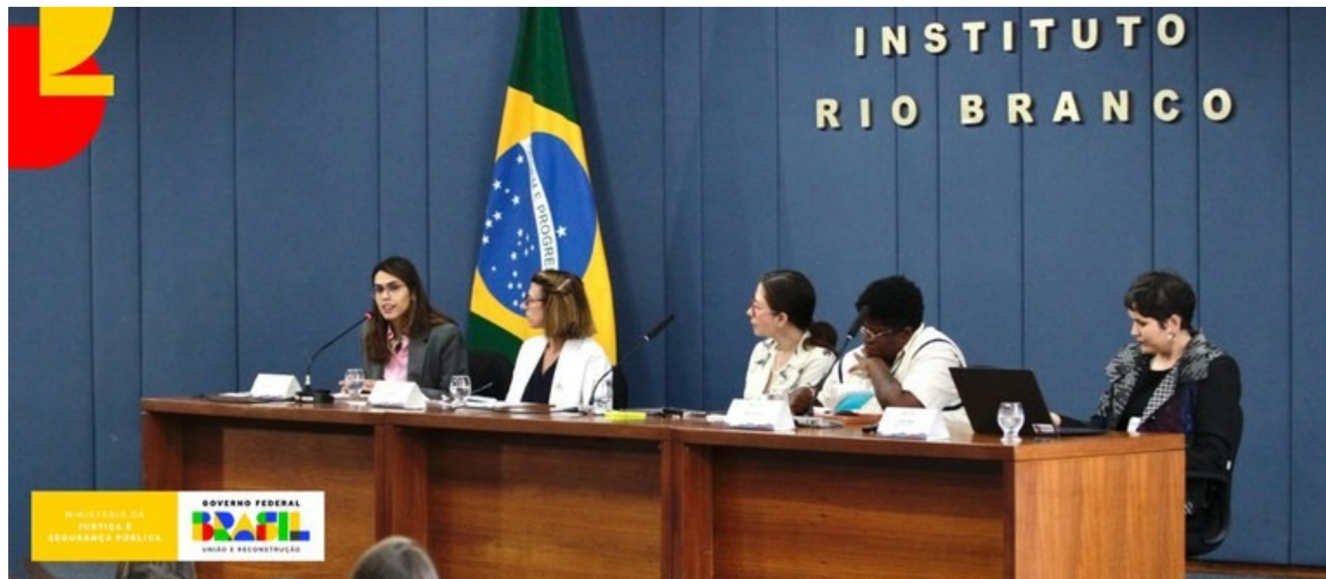
Participação em mesa de debate sobre IA e política externa - Seminário de Política Externa Feminista Inclusiva (Brasília, Instituto Rio Branco)