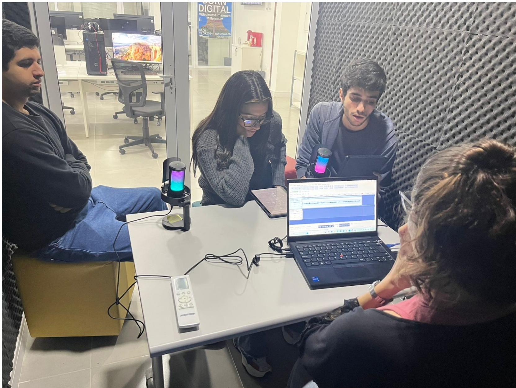
Gravação e edição de podcasts (com Instituto de Relações Internacionais)