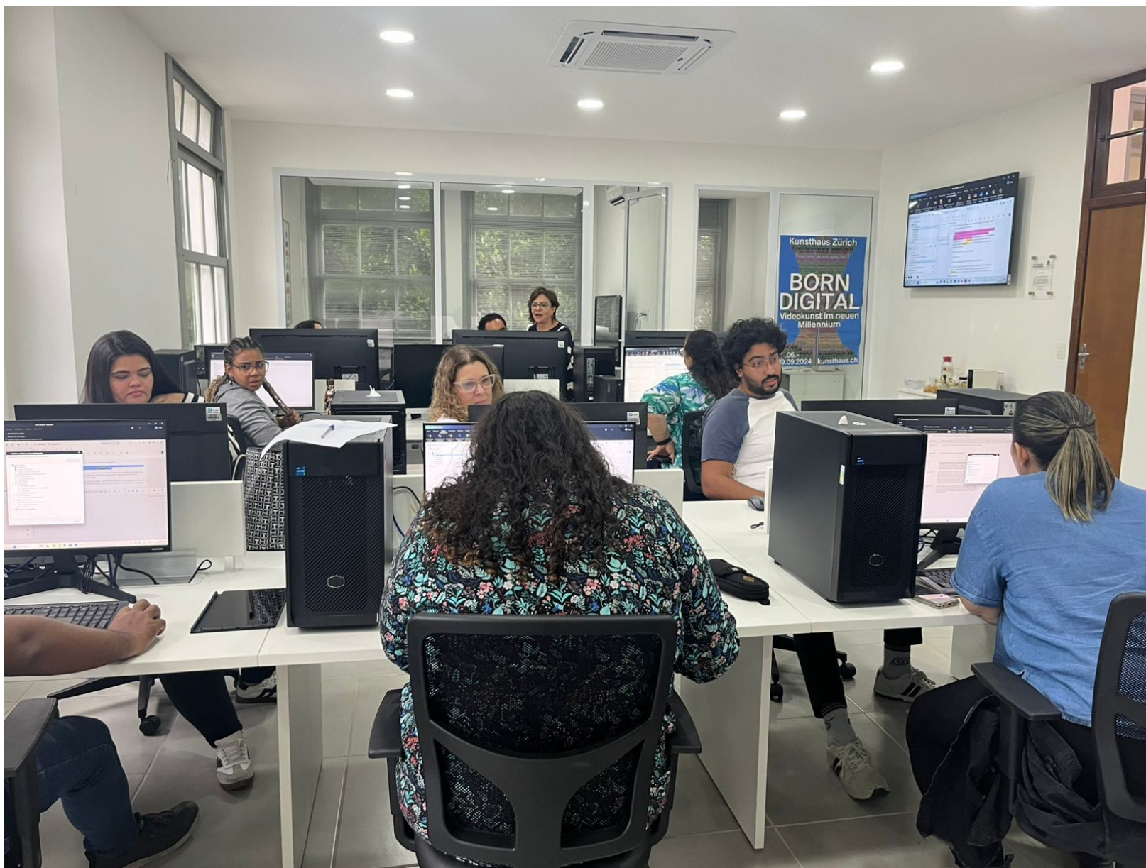
Oficina - MAXQDA (com Departamento de Educação)