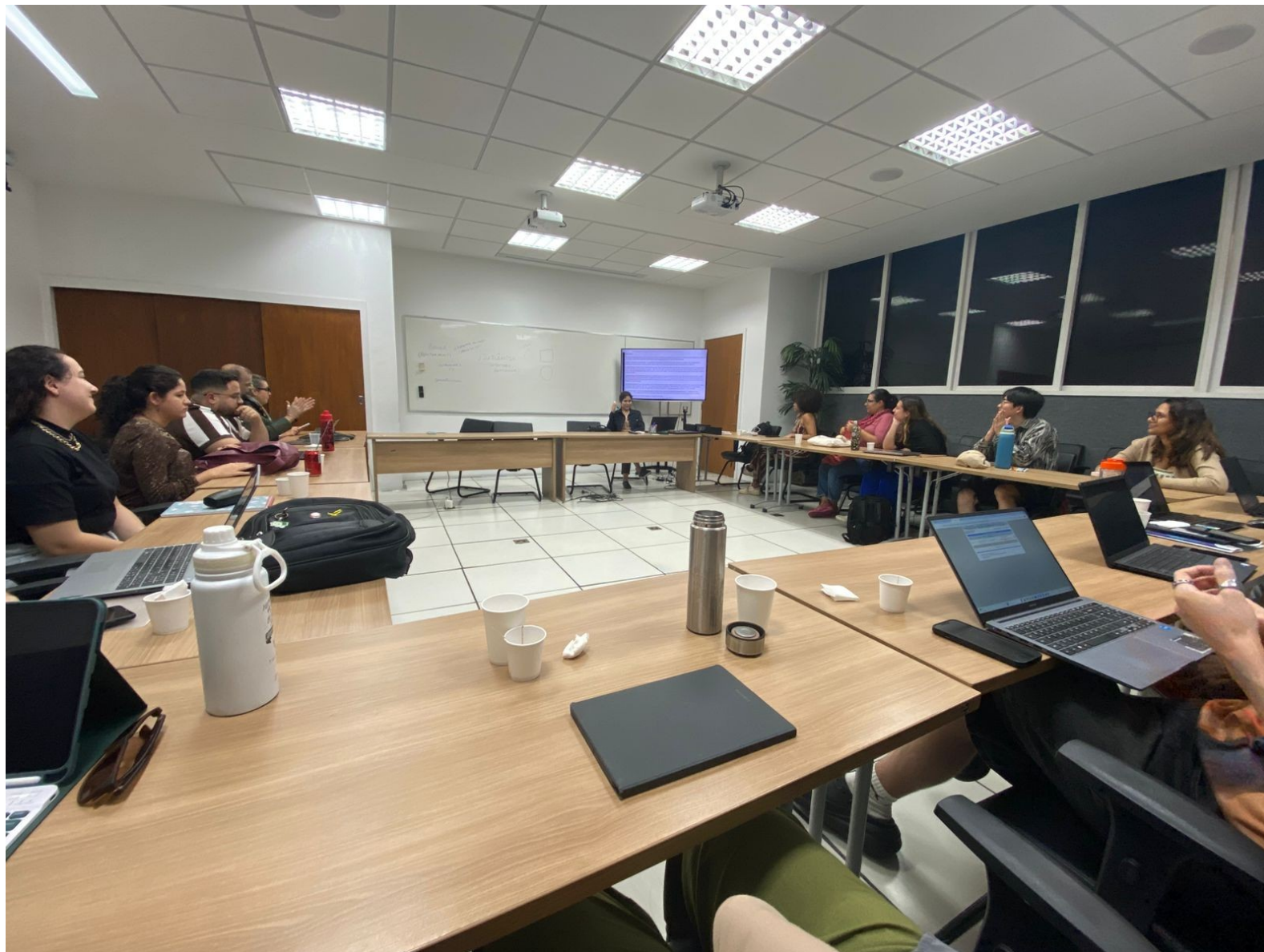
Minicurso IA na política internacional (com Laboratório de Metodologia / Instituto de Relações Internacionais PUC-Rio)